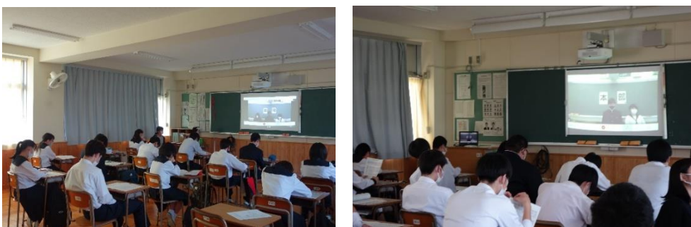
各クラスでの様子