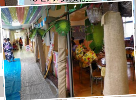
金の鳩賞 「3-2アメリカ文化」