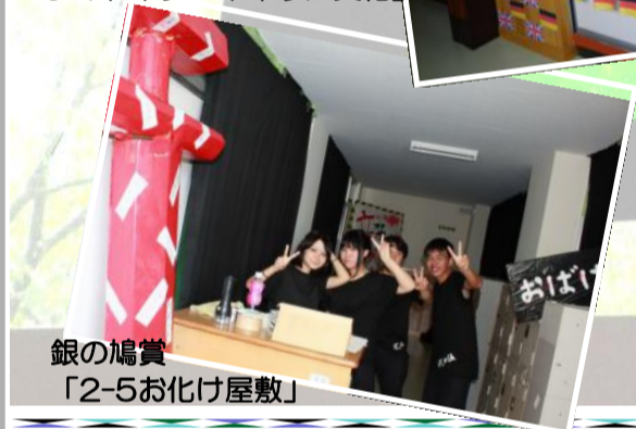
銀の鳩賞 「2-5お化け屋敷」