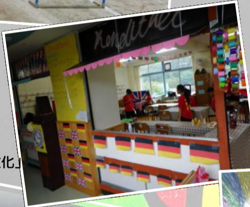
銅の鳩賞 「3-1ドイツ・イギリス文化」